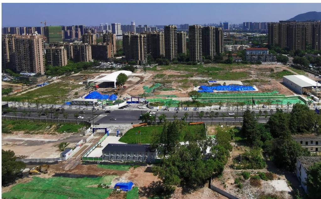
浙江新世纪金属材料现货市场退役地块修复工程项目

1) 土壤及地下水修复：公司开展的土壤及地下水修复项目主要为工业场地修复，通过工程、技术和政策等管理手段，将地块污染物移除、削减、固定或将风险控制在可接受水平的活动。公司掌握的多项核心技术，涵盖各种类型的土壤及地下水修复工程，涉及铜、锌、铅、铬、镍、砷、镉等多种重金属，以及挥发性有机物（VOCs）、半挥发性有机物（SVOCs）、石油烃（TPH）等有机污染物，在达到土壤及地下水污染物修复目标的同时，减少“异味扰民”，实现高效绿色修复治理的目标要求。