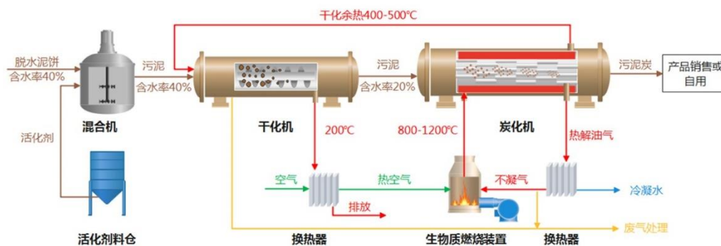
污泥炭化工艺流程图