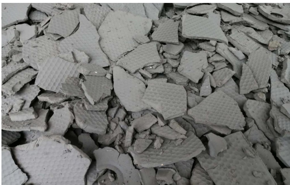
污泥淋滤深度脱水技术实物效果