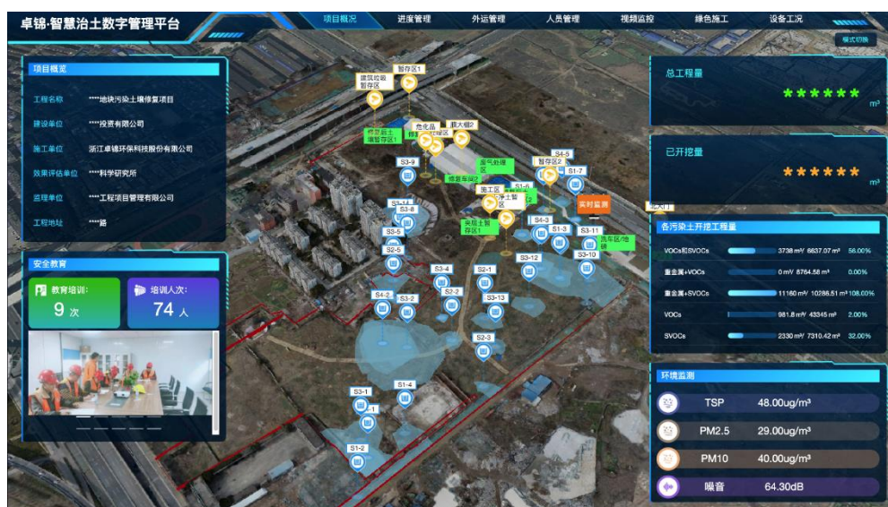
卓锦智慧治土数字管理平台

智慧环保将会是环保行业接下来发展的一个重点，公司内部设立有智慧环保事业部，聚集了环保专业与信息化专业团队，以智慧治水与智慧治土方面的传感器研发、监测检测模型的搭建与优化，以及环保大数据的共享与应用为重点，开展智慧+环保的融合创新。现阶段公司的智慧环保团队集中围绕公司优势主业进行“智慧+”赋能，已累计开发和应用了“智慧治土、智慧水环境、智慧装备管家、智慧运维”等平台。下一阶段，在智慧环保产品成熟后投放市场，丰富公司综合环保治理服务能力。