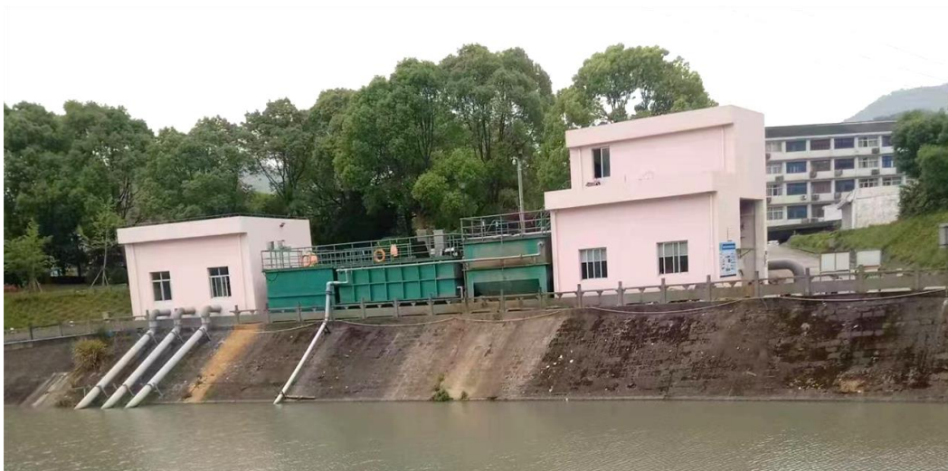
温岭市江夏大港水生态修复项目

统功能。公司的核心技术“智能河道活水系统”，通过涵盖数据采集、水文水质耦合模型和大数据分析的水环境智慧管理技术，实现水环境智慧配水与智慧水质调控。