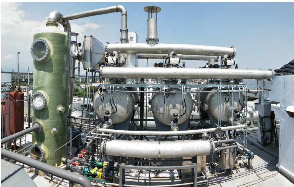
工业 VOCs 废气吸附-脱附-溶剂回收处理工艺包

2) 废气治理: 公司的废气治理业务主要为医药化工及市政领域的生产过程中涉及的 VOCs (挥发性有机化合物) 进行减排、处理与综合防治。公司主要通过综合运用“洗涤+吸附-脱附-溶剂回收”等核心技术, 对有机废气进行吸附分离, 并对分离的有机物进行回收再利用。