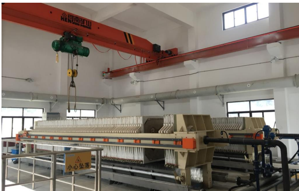
丽水庆元第二污水处理厂污泥深度脱水项目