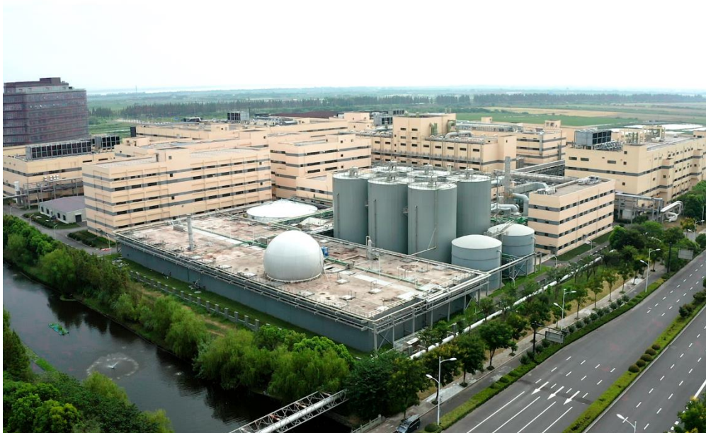
华东医药废水 EPC 总包项目

2) 废气治理: 公司的废气治理业务主要为医药化工及市政领域的生产过程中涉及的 VOCs (挥发性有机化合物) 进行减排、处理与综合防治。公司主要通过综合运用“洗涤+吸附-脱附-溶剂回收”等核心技术, 对有机废气进行吸附分离, 并对分离的有机物进行回收再利用。